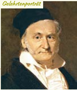
CARL FRIEDRICH GAUSS /// MATHEMATIKER, ASTRONOM, PHYSIKER – UND GEODÄT